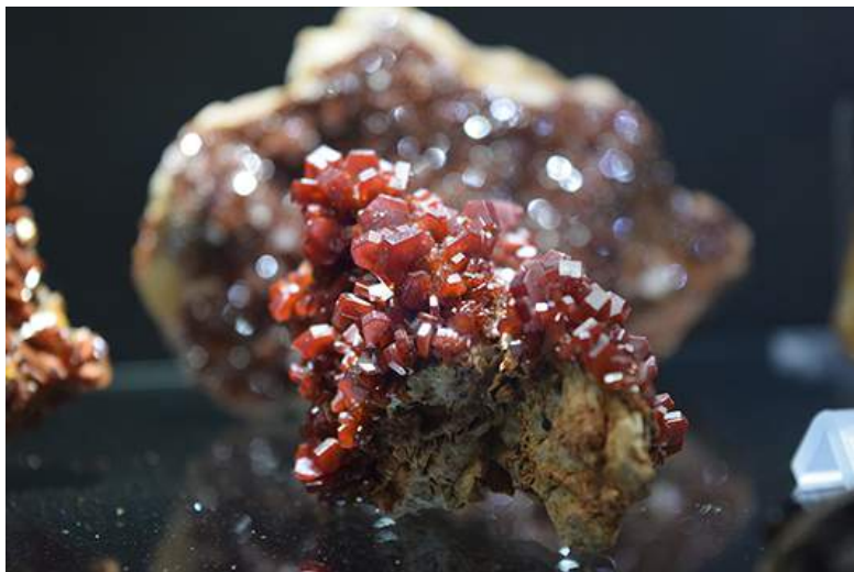
Vanadinit från Mexico – ett sällsynt mineral.