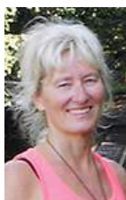
Text: Anna Sternfeldt AS är frilansjournalist.

– Det är viktigt för mig att träffa besökare, att få veta att mitt arbete betyder något för andra, säger han.