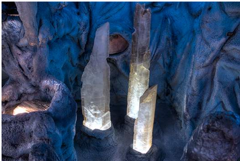
Selenitkristaller från "The Cave of Swords" i Naica, Mexiko.

Attraktionerna i sig har egen belysning. Kanske är skyltarna inte så frekventa som en kunskapstörstande besökare skulle önska, men här ligger fokus på upplevelsen.