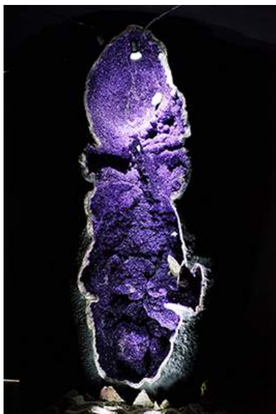
Världens största ametistgeod? "Kejsarinnan av Uruguay" är 3,3 meter hög och väger 2,5 ton.

Ghislaine, paret Boissevains yngsta dotter, som idag driver museet tillsammans med sin syster Cecilia, berättar att besökare ibland sätter sig här och mediterar för att det är så fridfullt.